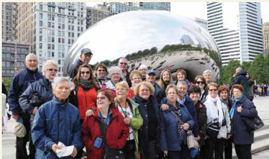
Parc du Millenium

C'est à bord de 4 autocars Grand Tourisme que les quelques 200 participants sont arrivés à Chicago, après avoir fait une halte pour la nuit à London, Ontario où ils ont visité le Temple de la Renommée Médicale Canadienne. Arrivés à Chicago le 19 en après-midi, ils y ont fait la visite de la Tour Willis, le 2 e plus grand immeuble du continent américain. C'est au 103 e étage, après seulement 45 secondes d'ascension, que les caméras se sont déchainées: plusieurs se sont fait photographier dans une cage de verre accrochée au mur de l'édifice à 412 mètres de hauteur... sur un plancher de verre. Pas très loin de cette tour, on y retrouve le point d'observation du John Hancock Center d'où l'on a un aperçu différent de la ville. De retour sur le plancher des vaches de nombreuses visites nous attendaient: Millenium Park, Macy's, Navy Pier, West Loop, South Loop, stade des White Socks, Hyde Park (chic quartier universitaire), Shedd Aquarium, Wrigley Field (stade des Cubs), pour n'en nommer que quelques-unes. Une petite croisière sur les canaux de Chicago a permis de découvrir la Ville des Vents sous un autre angle. Comme prix de présence, 8 chèques cadeaux de 200 $ chacun ont été gracieusement offerts par Victoria Bartoszewicz de l'agence Poltours. Mission accomplie... Chicago n'a plus beaucoup de secrets pour tous. Un gros merci à tous les collaborateurs: Jeanne Bélisle, Lyne Pérusse, Suzanne Gervais et Roger Bilodeau. Coordonnateur: Jean-Guy Migneault.