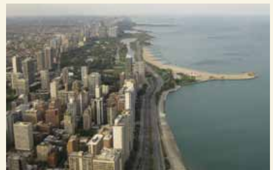
Vue de la Willis Tower