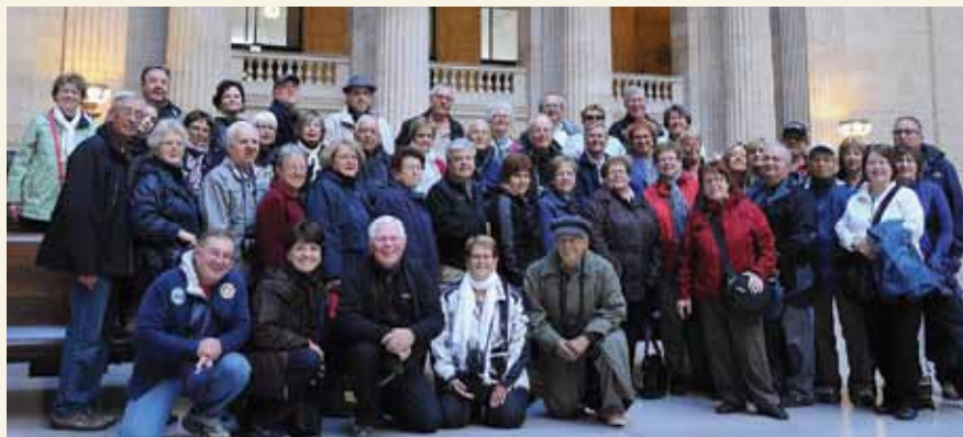
Gare de Chicago